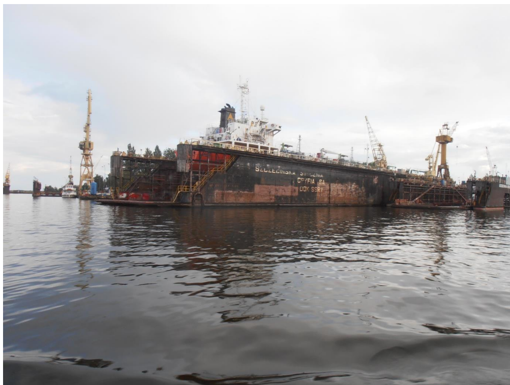
Rys. 2 Dla szczurów lądowych tak wygląda dok („podnośnik”) do remontu statków