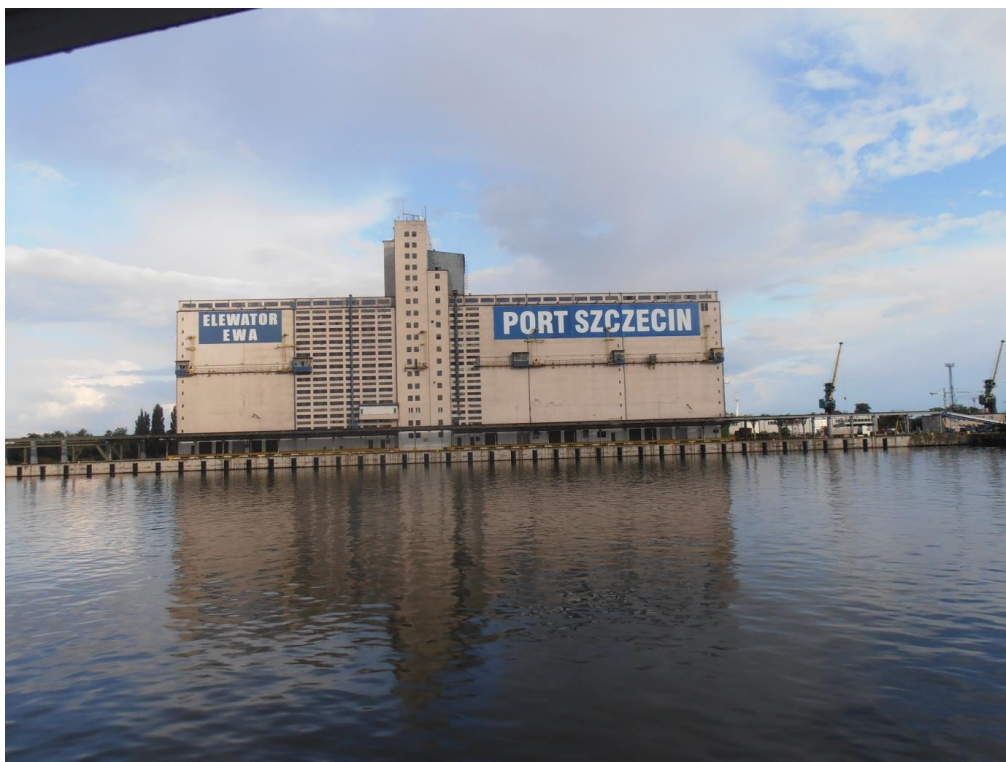
Rys. 1 Zdjęcie tego obiektu towarzyszyło przez lata czołówce telewizyjnej Kroniki Pomorza Szczecińskiego.